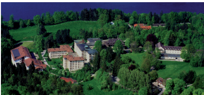
KJF-Fachklinik „Hochried“ in Murnau

„Mit der Jugend. Für die Zukunft!“ – eine moderne Botschaft von hoher Aktualität, die für die Katholische Jugendfürsorge der Diözese Augsburg e. V. (KJF) bereits seit Jahren gelebte Realität ist. Unter diesem Leitbild engagiert sich der Fachverband der Caritas in den Bereichen Kinder- und Jugendhilfe, Medizin und berufliche Rehabilitation. Mit Erfolg, wie die Zahlen eindrucksvoll belegen.